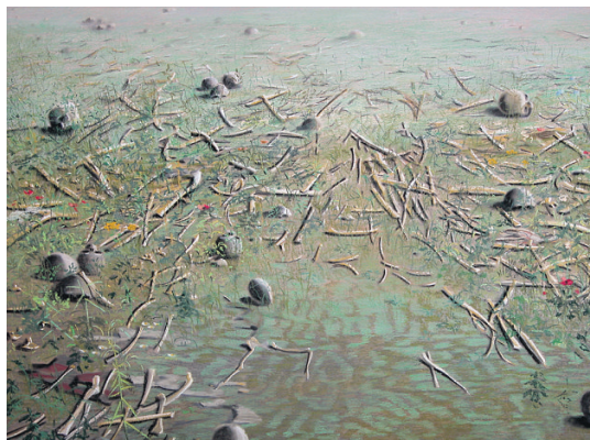
Schilderijen uit de film 'Getekend' van Olphaert den Otter.

krijt meer kon opnemen. Toen het pastel echt van de muur begon af te vallen, besepte ik dat de tekening zou sterven. Ik begon te wissen, voorzichtig, met de hand, stofmasker op.”